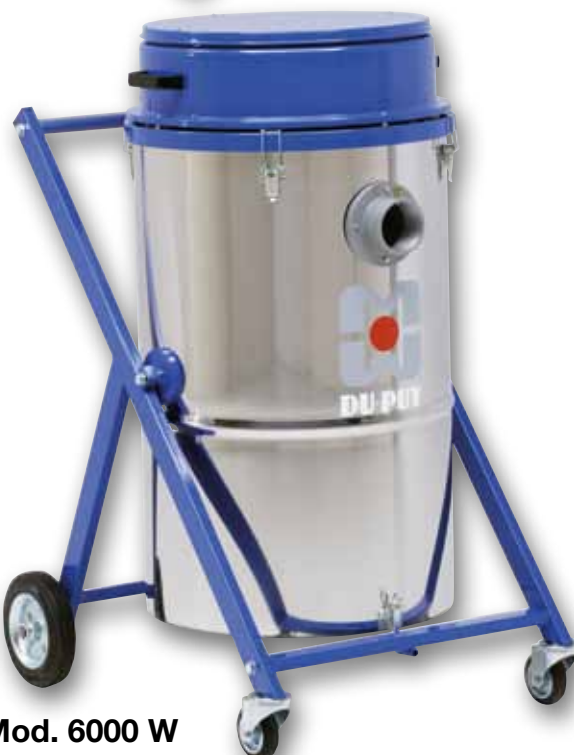
Mod. 6000 W