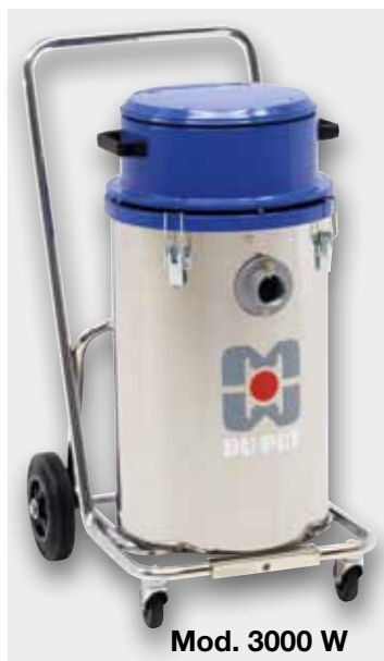
Mod. 3000 W