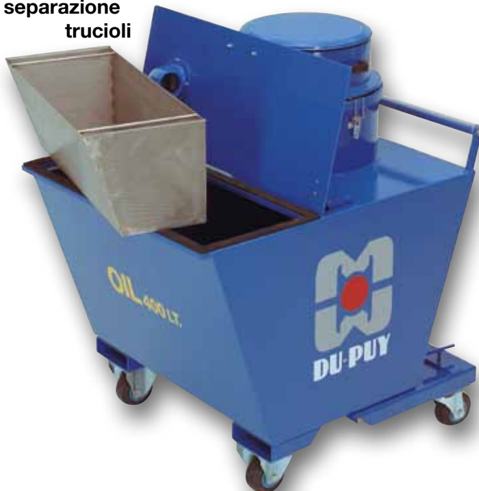
Cestello separazione trucioli

È possibile introdurre un cestello in acciaio forato per separare i trucioli dai liquidi che si depositano nella parte inferiore del contenitore per essere recuperati mediante una valvola da 2" 1/2.