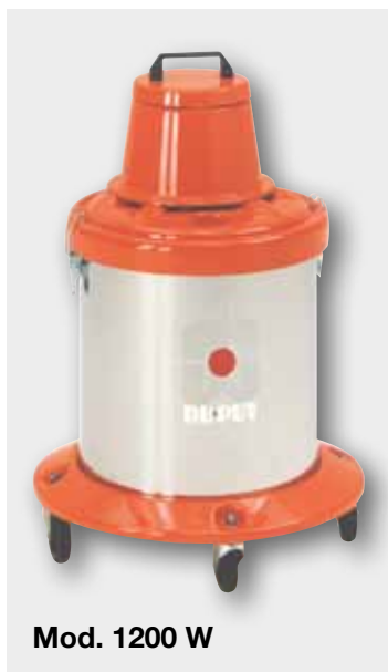
Mod. 1200 W