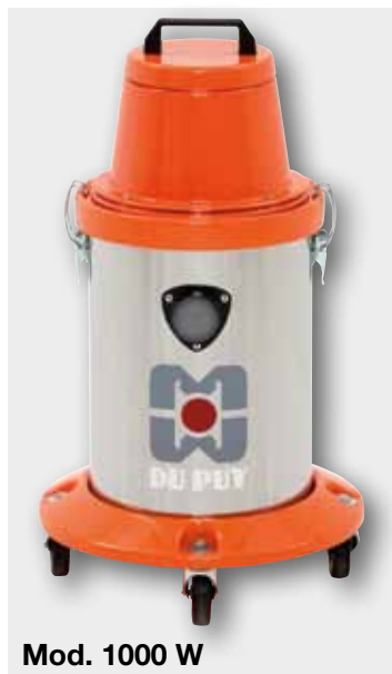
Mod. 1000 W