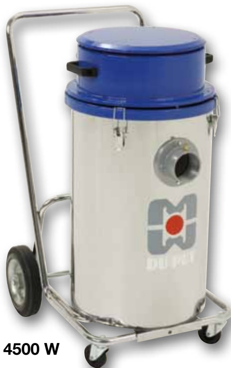
Mod. 4500 W