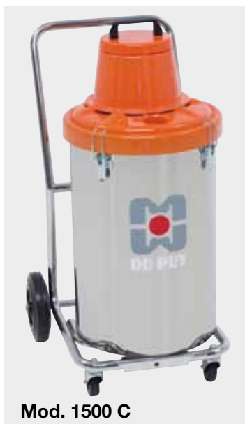
Mod. 1500 C