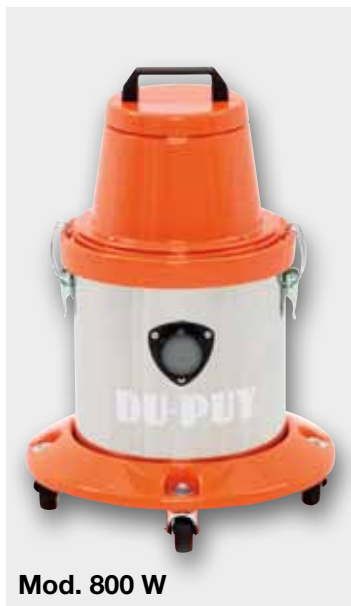
Mod. 800 W

Di solida costruzione e semplicità d'impiego, garantiscono una piena efficienza nelle più difficili condizioni di lavoro.