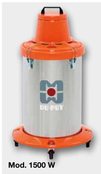
Mod. 1500 W